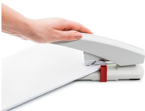
La grapadora de gruesos económica para tareas de mayor envergadura de hasta 100 hojas