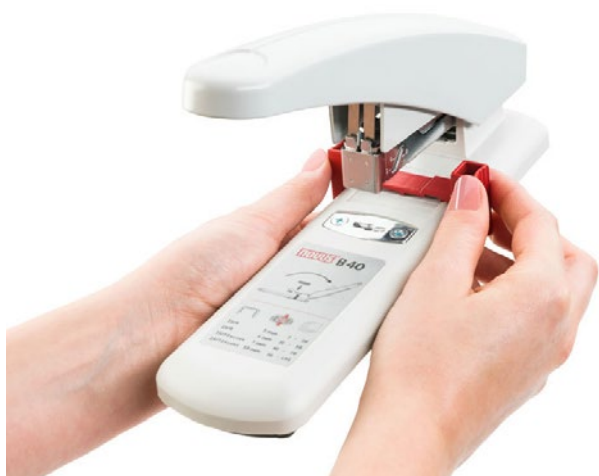
Práctica guía de papel para un grapado en diagonal preciso