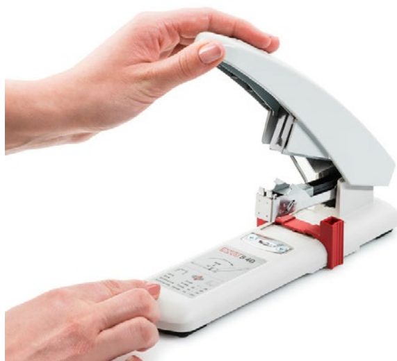
Cargador de apertura superior con eje de doble guía montada sobre un resorte para evitar atasco de grapas