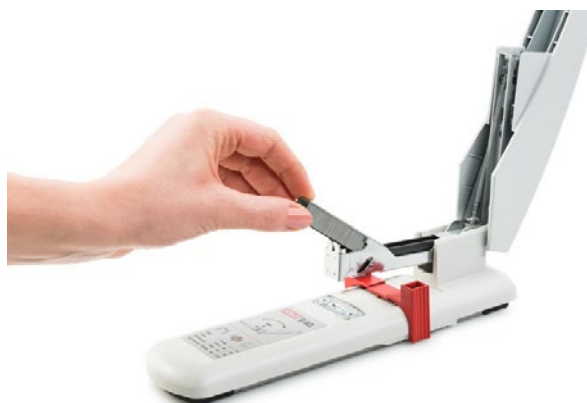
El mecanismo de carga superior permite introducir las grapas en el dispositivo tras levantar la parte superior.